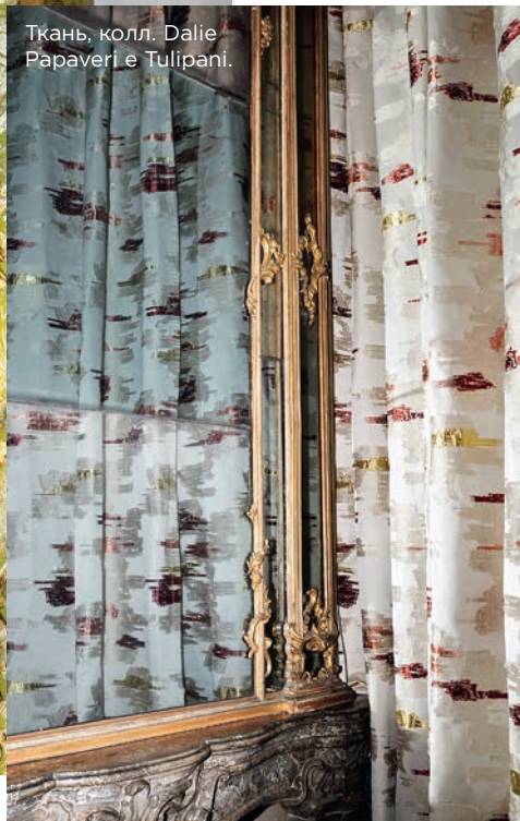
Ткань, колл. Dalie Papaveri e Tulipani.